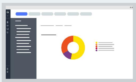
ESTADÍSTICAS POR EMPRESA